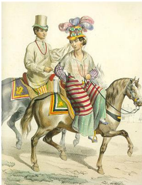
Filipinos (Public Domain)